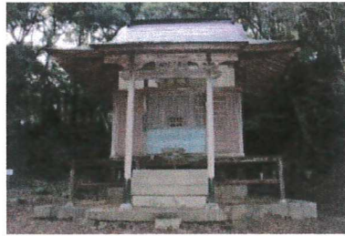
岩屋奥ノ院毘沙門堂

すべての歴史は、生きている人間がつくってきたものである。現在起きたことも、時期が経てば過去のものとなる。そのため過去の歴史を学ぶことは、現在の人たちが何をすべきかを見出すヒントとなる。歴史は生きていく人が繋いでいくため、大きな夢や目的を持つことはとても大事なのだ。