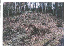
上土田墓地上がりかけ